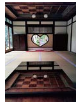
近江豪商(マーチャント)ミュージアム