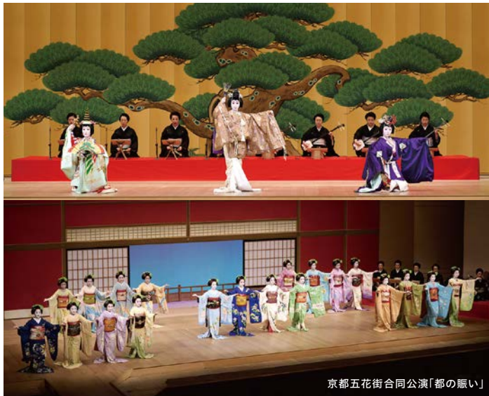
京都五花街合同公演「都の賑い」

都の初夏を艶やかに彩る風物詩、京都五花街合同公演「都の賑い」。年に1度、祇園甲部、宮川町、先斗町、上七軒、祇園東の芸妓舞妓が一堂に会する特別な舞台を特別席より観覧します。翌日は天台声明大原流発祥の地、大原に深緑の古刹を訪ねて。名店の京料理、夏の訪れを知らせる鮎料理にも心が躍る2日間です。