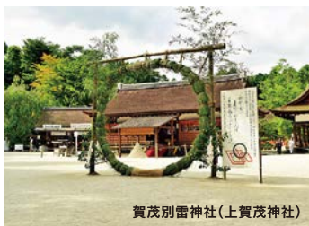
賀茂別雷神社(上賀茂神社)

六月晦日に、今年前半の厄を祓い残り半年の無病息災を祈る「夏越祓」。「賀茂別雷神社(上賀茂神社)」の夏越神事への参列と、この日にいただく風習がある和菓子「水無月」で、古来伝わる年中行事に親しみます。