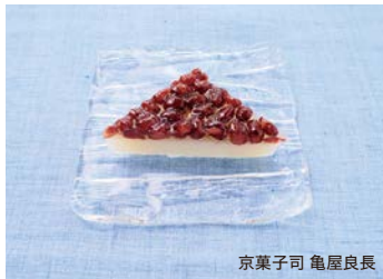
京菓子司 亀屋良長