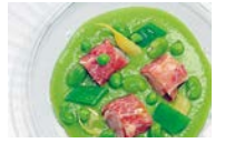
リストランテ キメラ