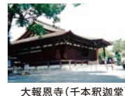
大報恩寺(千本釈迦堂)

● 「大報恩寺(千本釈迦堂)」 名木「阿亀桜(おかめさくら)」 や国宝に指定された 「木造六観音菩薩像」 「木造地藏菩薩立像」を拝観